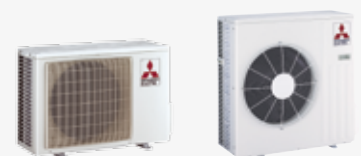
MUZ-EF 25/35/42 VE MUZ-EF 50 VE