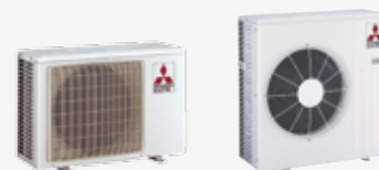
MUZ-EF 25/35/42 VE MUZ-EF 50 VE